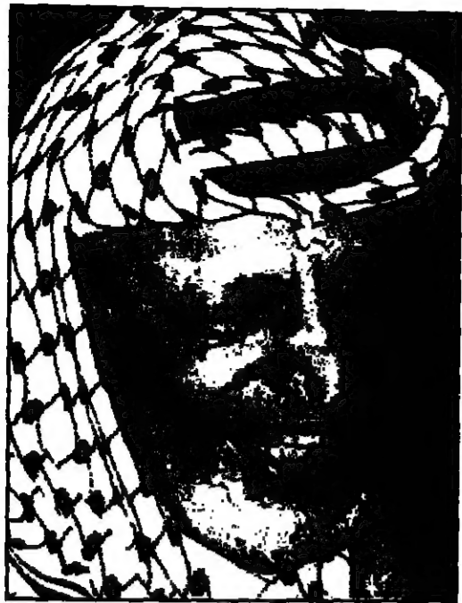
الرئيس الفلسطيني عرفات